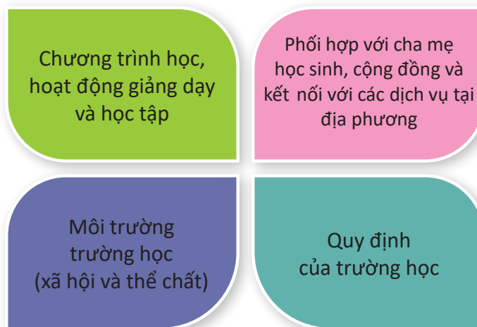
Hình 3: Mô hình trường học nâng cao sức khỏe toàn diện